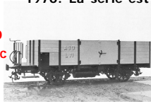
Wagon ASD typ "L" avec plateforme