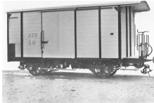
Wagon ASD typ "K" avec plateforme

L'ASD dispose également de 12 wagons marchandises repartis en typ "K", "L" et "M" (à voir en bas). Portant une livrée grise à l'origine, ils sont progressivement repeints en rouge à partir des années 1970. La série est limitée de 10 wagons par typ.