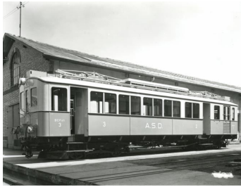
ASD BCFe 4/4 no 3 (Set no 7)

L'automotrice BCFe 4/4 no 2, construite par SWS et AEG, fait partir d'une série de trois BCFe 4/4 et deux CFZe 4/4 mises en service en 1913 pour l'ouverture du premier tronçon Aigle - Le Sépey. A cette époque, les véhicules voyageurs de la compagnie ASD portent une livrée rouge grenat. Le soir du 26 juin 1940 un incendie au dépôt Aigle détruit 3 automotrices et 4 remorques. L'automotrice no 2 (plus tard no 3 et 11), assurant le dernier train montant du soir, est épargnée par les flammes. Elle est modernisée en 1942 et renumérotée no 3. A cette occasion, elle reçoit la nouvelle livrée de l'ASD gris/bleue/crème.