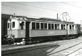
ASD ABFe 4/4 no 11 (Set no 10)