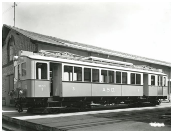
ASD BCFe 4/4 no 3 (Set no 7)

L'automotrice BCFe 4/4 no 2, construite par SWS et AEG, fait partir d'une série de trois BCFe 4/4 et deux CFZe 4/4 mises en service en 1913 pour l'ouverture du premier tronçon Aigle - Le Sépey. A cette époque, les véhicules voyageurs de la compagnie ASD portent une livrée rouge grenat. Le soir du 26 juin 1940 un incendie au dépôt Aigle détruit 3 automotrices et 4 remorques. L'automotrice no 2 (plus tard no 3 et 11), assurant le dernier train montant du soir, est épargnée par les flammes. Elle est modernisée en 1942 et renumérotée no 3. A cette occasion, elle reçoit la nouvelle livrée de l'ASD gris/bleue/crème.