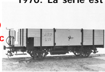
Wagon ASD typ "L" avec plateforme