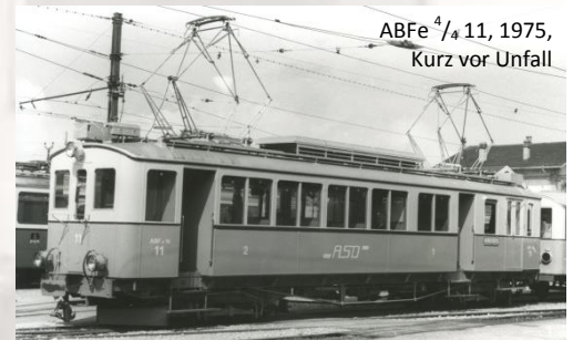
ABFe 4 / 4 11, 1975, Kurz vor Unfall

Da die Vereinigung mit der MOB 1942 nicht zustande kam, entschloss sich die ASD sämtliche Leerlaufbremsen Hardy auf Kompressorenbremsen Westinghouse umzubauen. Die Fahrzeuge waren somit mit der AOM und MCM kompatibel.