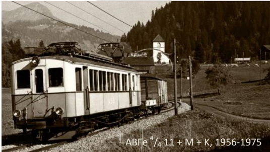
ABFe 4 / 4 11 + M + K, 1956-1975

Am Abend des 26. Juni 1940 vernichtete ein Brand im Depot Aigle drei Triebfahrzeuge sowie vier Wagen. Das Triebfahrzeug N° 2 entkam den Flammen. Es wurde modernisiert und 1942 als N° 3 umnummeriert aber, die so typischen halb-Fenster sind konserviert. Es war auch der Zeitpunkt wo die ASD Farben grau/crème wurden.