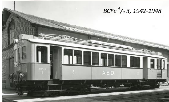
BCFe 4 / 4 3, 1942-1948

BCFe 4 / 4 3, ABFe 4 / 4 11 + K 41-44 + M 105-108