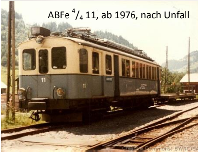
ABFe 4 / 4 11, ab 1976, nach Unfall

Der Verein ASD 1914 hat sich, in Zusammenarbeit mit Fulgurex, entschlossen dieser Geschichte trächtiges Fahrzeug mit den Wagen mit einer kleinen limitierten Serie von Modellen zu honorieren. Die Transports Publics du Chablais (TPC) unterstützen dieses Projekt. Die Modelle sind nummeriert und mit einem ESU DCC Digitaldekoder ausgestattet, was ein perfektes Fahren in digitaler sowie analoger Weise gestattet. Diese einmalige Serie von 150 Sets ist aus Messing und von Hand hergestellt. Lieferung voraussichtlich Frühling 2016. Mindestradius 420 mm.