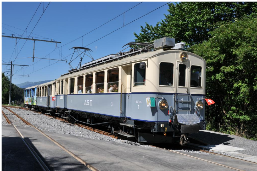
Le 6 juillet 2014, le train du centenaire passe à Exergillod

Pour vous abonner / désabonner de cette newsletter, cliquer ici