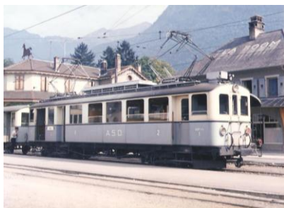
ABDe 4 / 4 1 à Aigle vers 1975

Les revendeurs spécialisés peuvent obtenir des informations pour cette série de modèles soit auprès de l'association ASD 1914 ( info@asd1914.com ) soit auprès de Fulgurex ( fulgurex.sa@bluewin.ch )